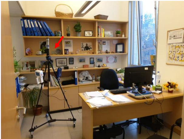
תמונה 5 : חדר 208, מזכירות המחלקה לאנגלית