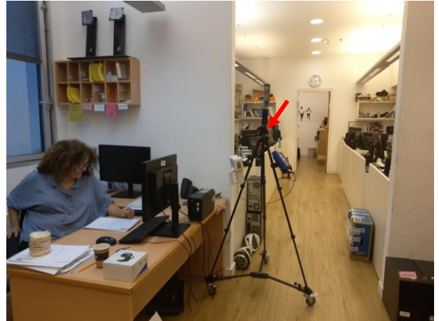
תמונה 2 : מעבדת מחשבים. מקום הבדיקה מסומן בחץ.