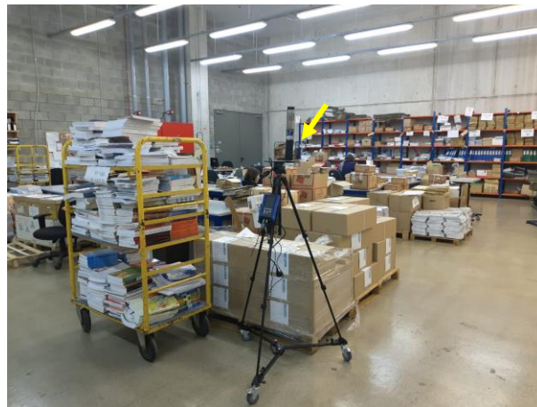
תמונה 4 : מחלקת הפעלה. מקום הבדיקה מסומן בחץ.