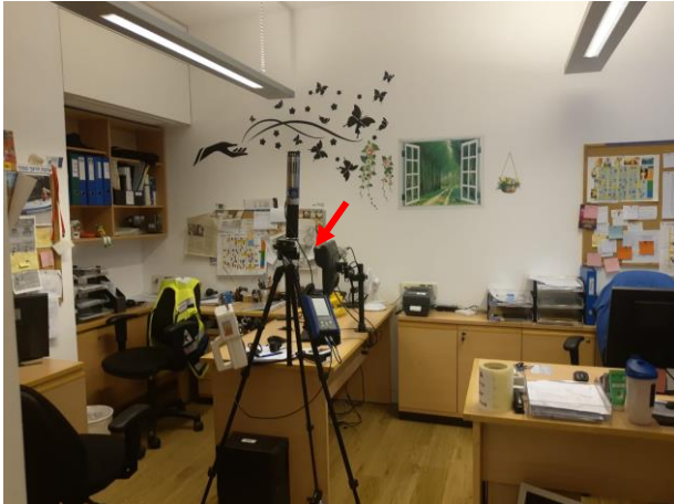
תמונה 3 : חדר רכש. מקום הבדיקה מסומן בחץ.