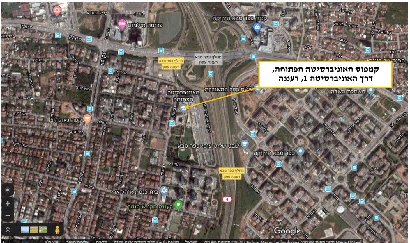
תמונה 1: תצ"א של האזור

קמפוס האוניברסיטה הפתוחה נמצא בשולי העיר רעננה, סמוך לאזור התעשייה וצמוד לעורקי תחבורה בינעירוניים ראשיים.